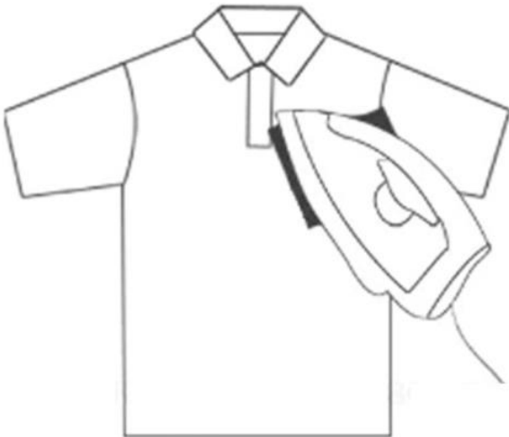
3- Parche para planchar en alto durante unos 30 segundos