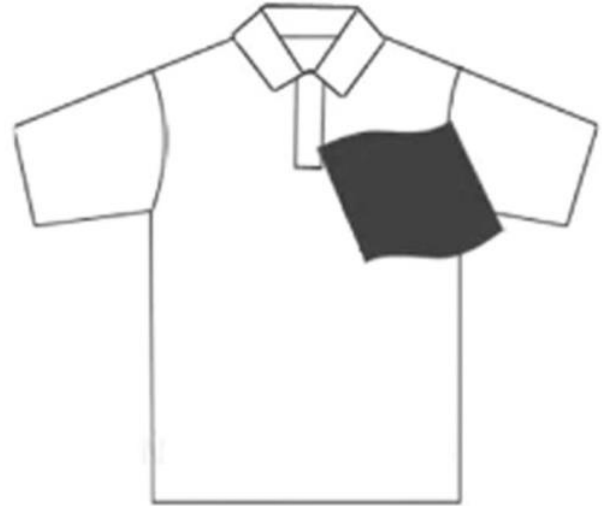
2- Coloque la tela de algodón sobre el parche