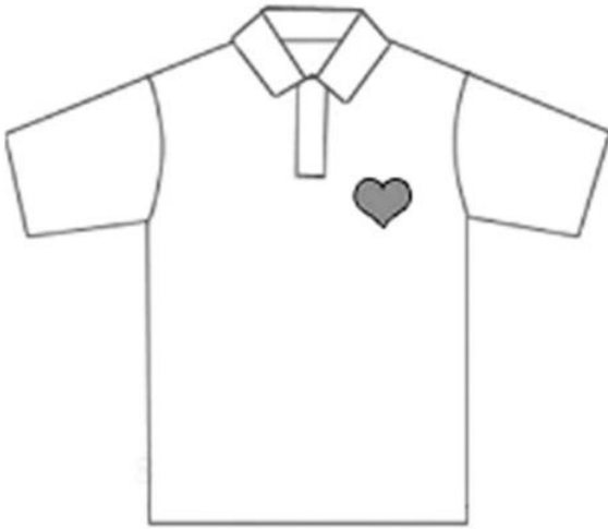
1- Pon el parche en tu tela con el lado bordado hacia arriba.